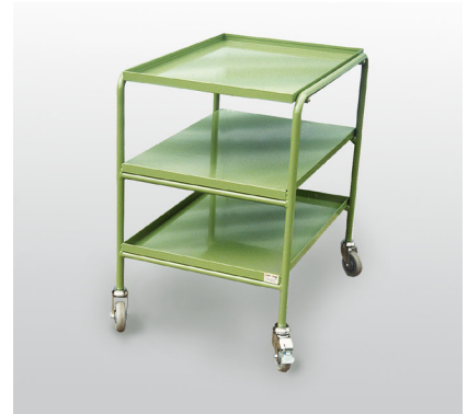
Tischblatt und Tablare in Stahlblech Plateau supérieur et tablar en tôle d'acier