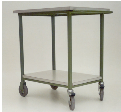
Tischblatt und Tablar mit allseitigem Kunststoffbelag Plateau supérieur et tablar contrecolés avec panneaux synthétiques de tous côtés