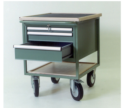
Werkzeugboy mit Schubladenblock, Tischblatt mit Gummimatte abgedeckt Chariot d'outillage avec tiroirs, plateau supérieur muni d'un tapis en caoutchouc