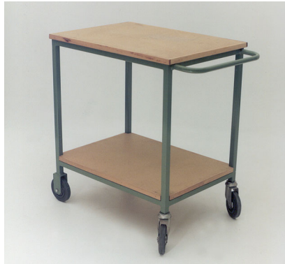
Tischblatt und Tablar in Novopan Plateau supérieur et tablar en Novopan

Plateau: 700 x 500 / 800 x 600 / 1000 x 700 / 1200 x 800 mm Hauteur: 700 / 800 / 900 mm